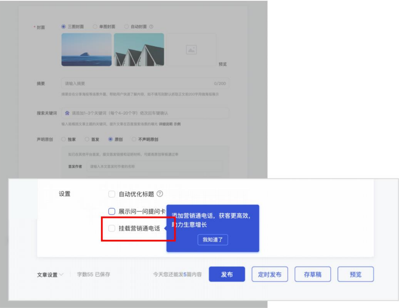
图文编辑器下方配置模块

在图文编辑器下方配置模块，勾选「挂载营销通电话」选项后，点击「知道了，去挂载」，打开电话配置弹窗。