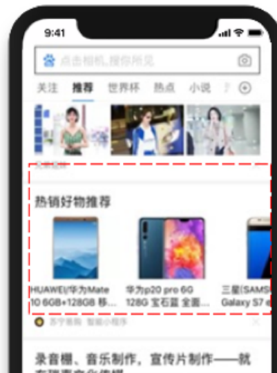
信息流分发-横滑卡片