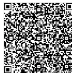
去掉Demo中的path和 query参数,也会调起到小程序首页。但是无法追溯商业推广计划来源