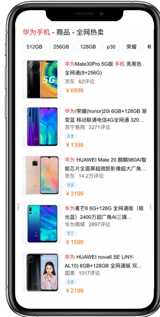
▲ 移动端全网热卖卡 (仅支持百度APP端外竞价)