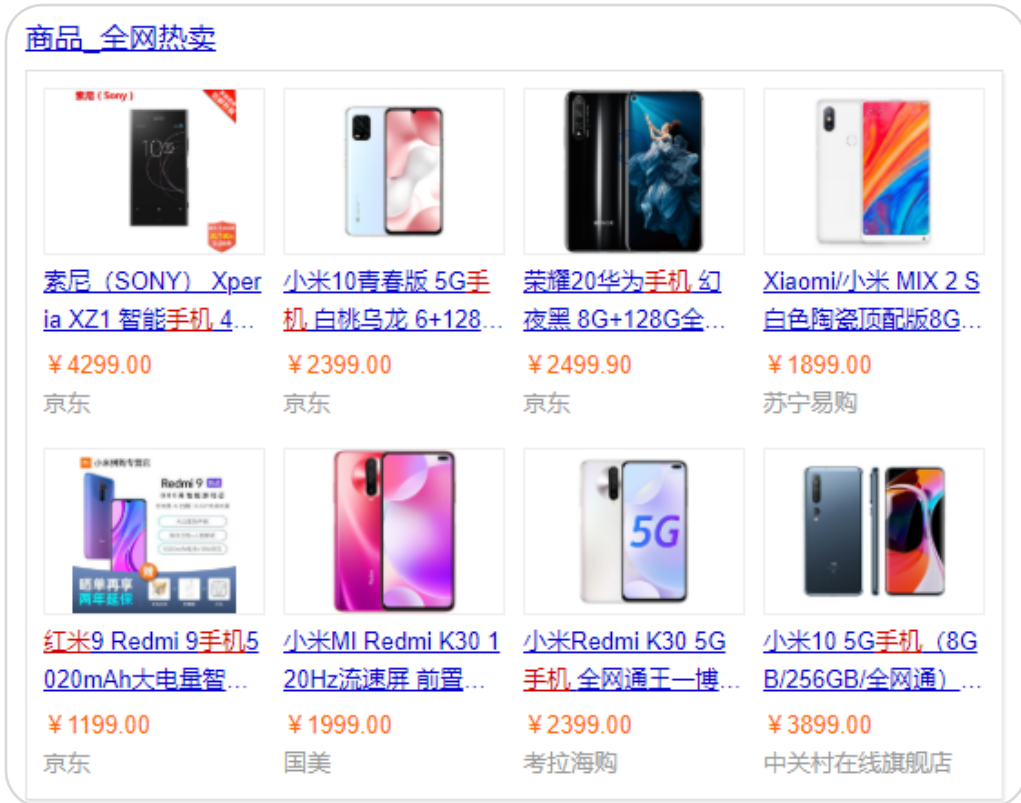
▲ 全新 PC全网热卖卡