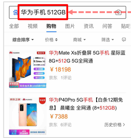
▲ 移动端购物频道页