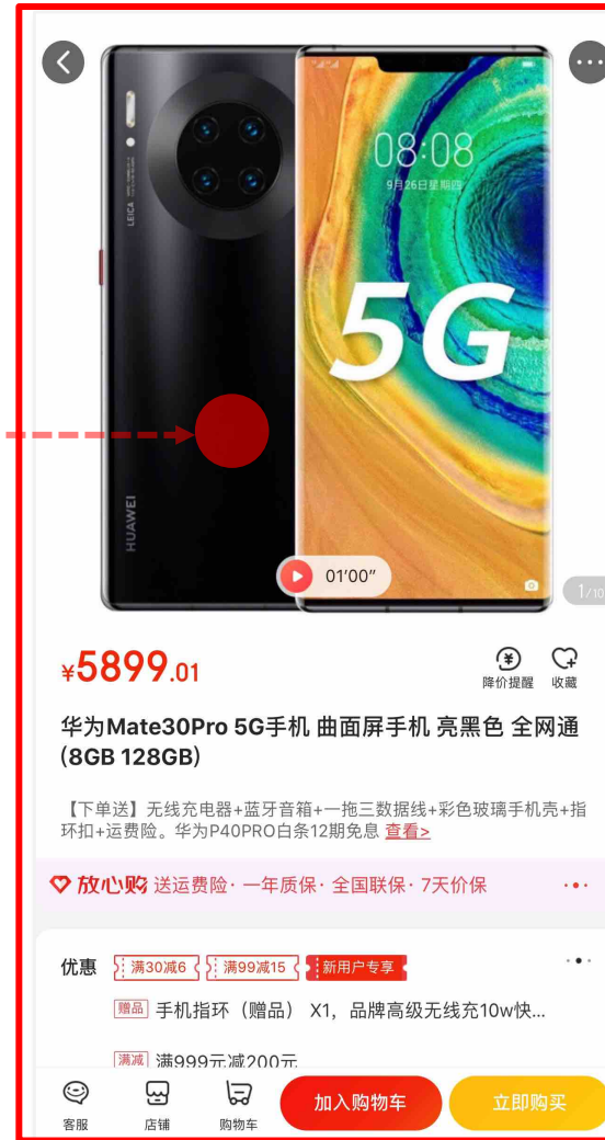
▲ 移动端商品详情页