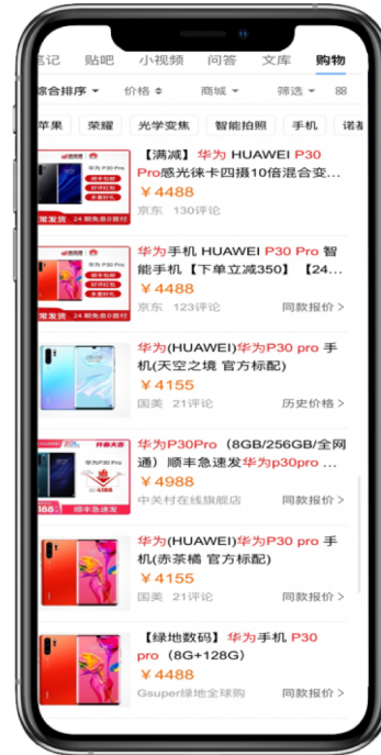
▲ 移动端购物频道页