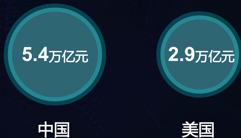
2016年零售电商交易规模